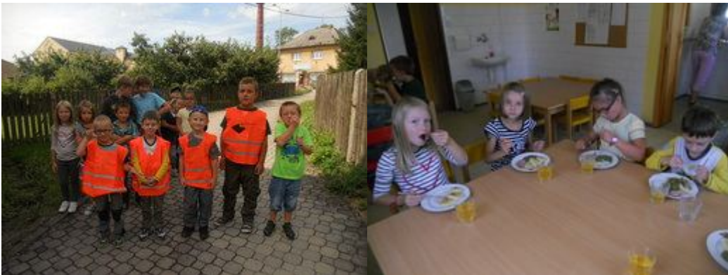
Školní rok byl slavnostně zahájen 1.zářím - ve společnosti rodičů a dalších hostů jsme přivítali osm prvňáčků.