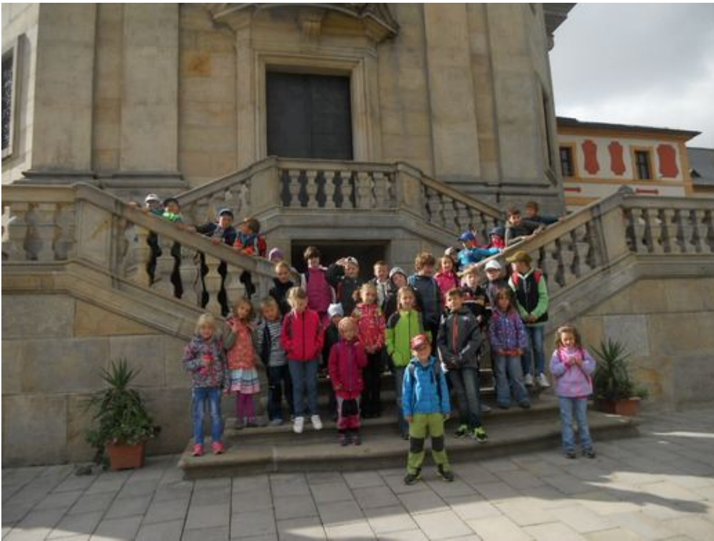
Cestou na oběd a v jídelně