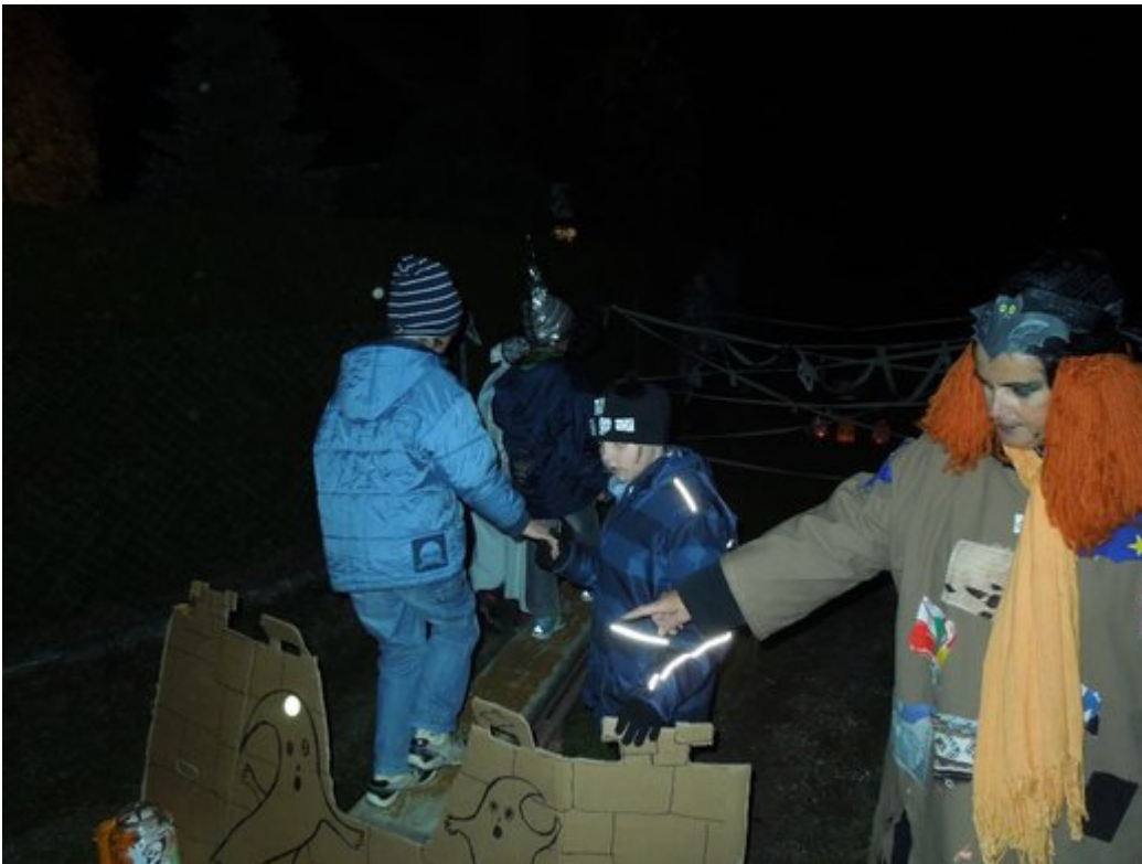
Poslední prázdninový den jsem měli ve škole tradiční kocbeřské strašidlení.